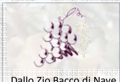
Dallo Zio Bacco di Nave